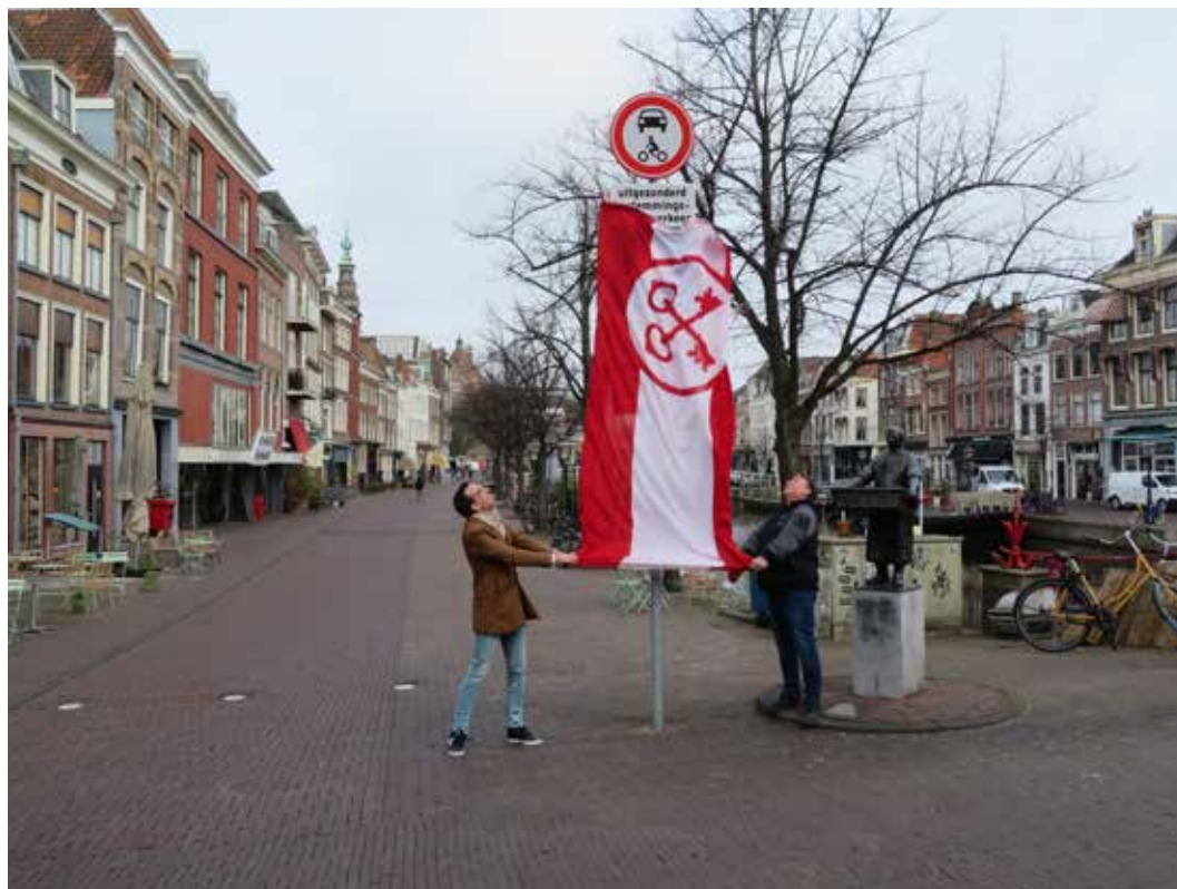
Onthulling nieuwe verkeersborden Botermarkt.

Eind januari 2022 is een verkeersbesluit gepubliceerd voor de Nieuwe Rijn en Botermarkt. Daarbij worden de Nieuwe Rijn en Botermarkt afgesloten met verbodsborden waarbij bestemmingsverkeer nog toegang heeft. Deze borden zijn vanaf 14 maart van kracht.