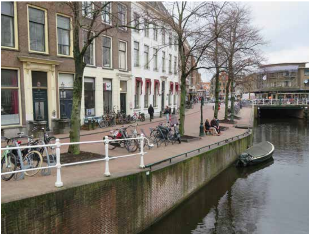
Nieuwe situatie Steenschuur.

In januari 2022 is van het noordelijk deel van het Steenschuur, tussen de Groenebrug en de Breestraat, een fietspad gemaakt en zijn er permanente fietsenrekken gekomen op de plaats van de parkeerplaatsen.