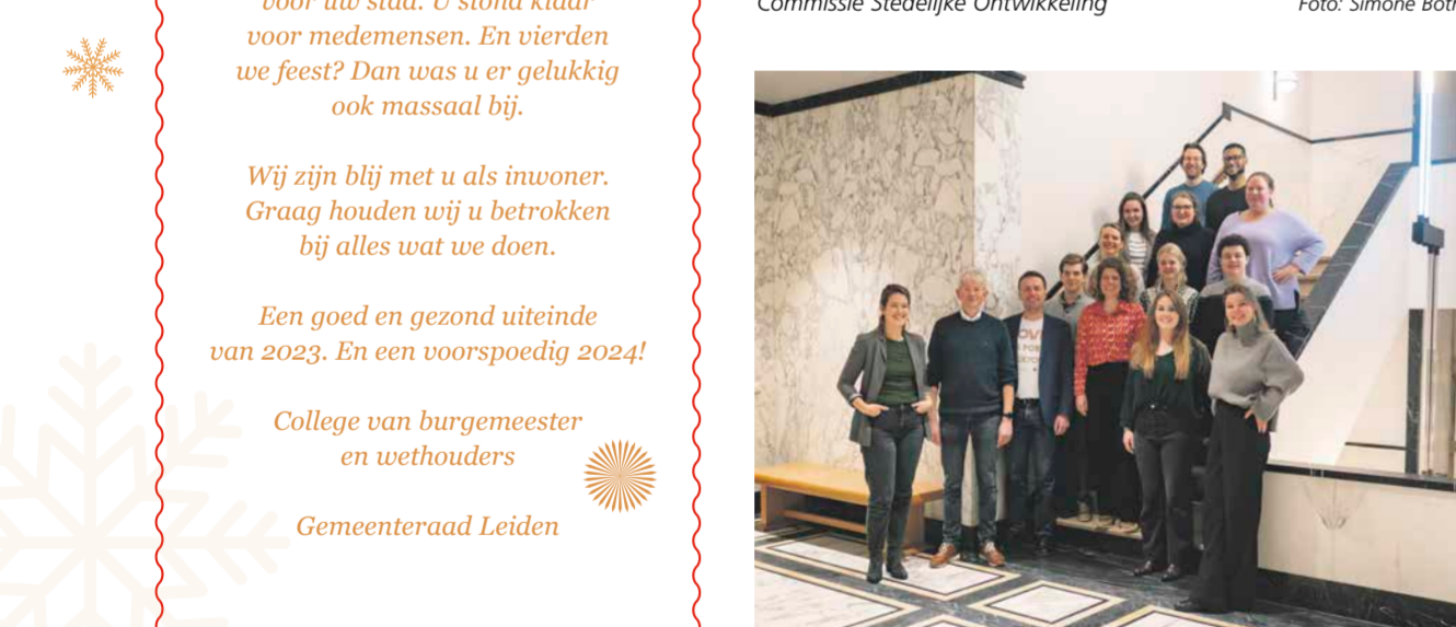
Commissie Onderwijs & Samenleving