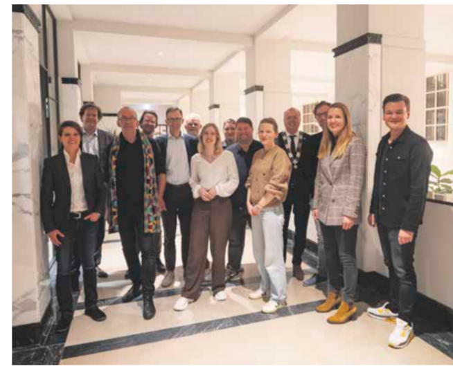
Commissie Leefbaarheid en Bereikbaarheid