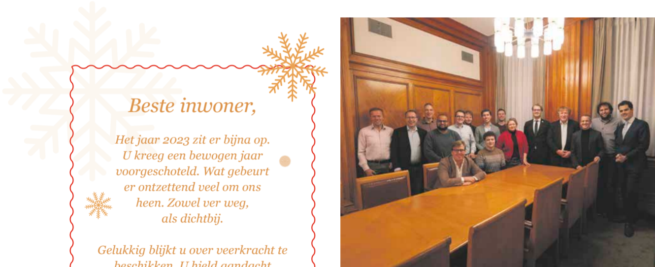
Commissie Stedelijke Ontwikkeling

Oud en nieuw moet een veilig feest voor iedereen zijn. Hou daarom rekening met elkaar, met mensen, dieren en de natuur. Op deze pagina vindt u alle informatie over de jaarwisseling in Leiden. Een fijne en veilige jaarwisseling en een goed 2024 toegewenst!