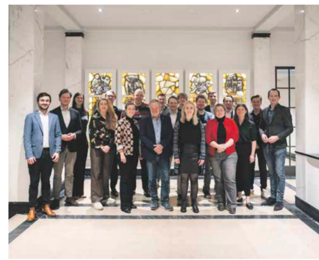
Commissie Werk & Middelen